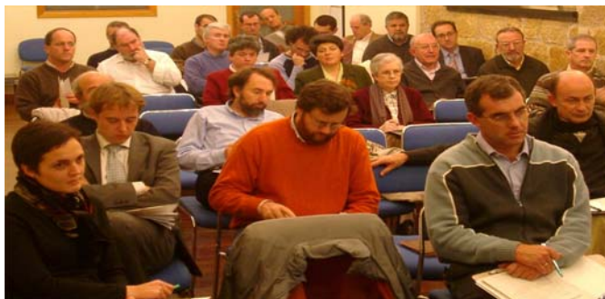
Reunión de Junta de Fundadores y Colaboradores de Fiare celebrada en Bilbao el 23 de octubre de 2003

Conformada por las organizaciones y las personas que han participado en el proceso de constitución de la Fundación o que con posterioridad se han adherido al proyecto. Constituye la base social de la Fundación, cuya voluntad queda plasmada explícitamente en los estatutos, en el objeto y los fines fundacionales, a los que habrá de responder la gestión que realice el Patronato.