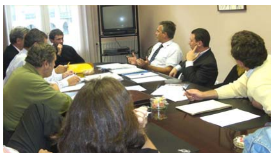
Celebración de la primera reunión de trabajo centrada en los preparativos del “Estudio de Viabilidad” y el “Plan de Negocio” de la Banca Ética Vasca